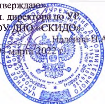
График учебного процесса на 2021-2022 уч. год