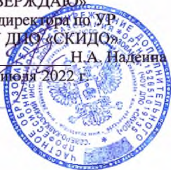
График учебного процесса на 2021-2022 уч. год

по дополнительной профессиональной программе повышения квалификации