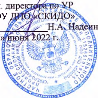
График учебного процесса на 2021-2022 уч. год

по дополнительной профессиональной программе повышения квалификации