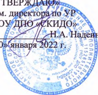
График учебного процесса на 2021-2022 уч. год

по дополнительной профессиональной программе повышения квалификации