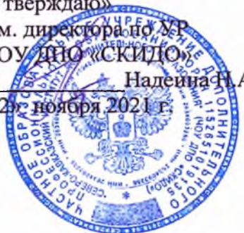
График учебного процесса на 2021-2022 уч. год

по дополнительной профессиональной программе повышения квалификации