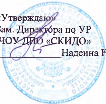
График учебного процесса на 2019-2020 уч. год

по дополнительной профессиональной программе профессиональной переподготовки «Педагогика и методика дополнительного образования детей и взрослых»